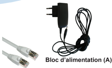
Bloc d'alimentation (A)